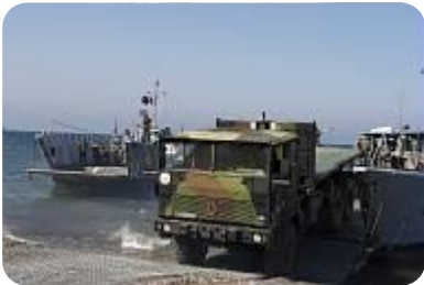
Poids lourd : TRM 10 000