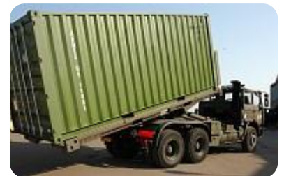
Super poids-lourd VTL-R