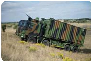
Poids lourd : PPLOG (porteur polyvalent logistique)